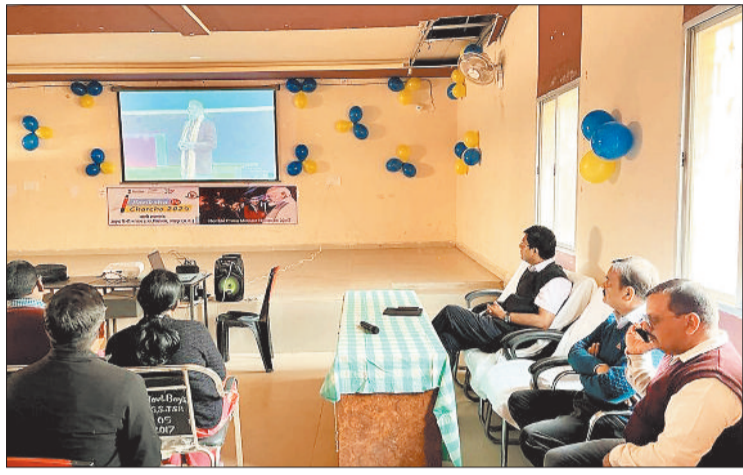
परीक्षा में चर्चा : एलईडी पर प्रधानमंत्री को सुनते अधिकारी-कर्मचारी।

इस कार्यक्रम का जशपुर सहित जिलेभर के स्कूलों में सीधा प्रसारण हुआ। जिससे छात्रों को बेहतर मार्गदर्शन मिला। जशपुर जिले अंतर्गत सभी आठ विकासखंड के समस्त शासकीय एवं अशासकीय पूर्व माध्यमिक शाला हाई स्कूल एवं हायर सेकेंडरी स्कूलों में कार्यक्रम का सीधा प्रसारण विभिन्न इलेक्ट्रॉनिक माध्यमों से शाला के अध्यक्ष/छात्रों को दिखाया गया। सभी विकासखंड में से कुछ विद्यालयों में जनप्रतिनिधि एवं पालको के साथ-साथ वहां के अधिकारीगण के उपस्थिति में इस कार्यक्रम का